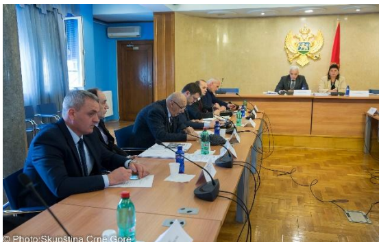
Treća sjednica Odbora za ljudska prava i slobode, 7. mart 2017. godine