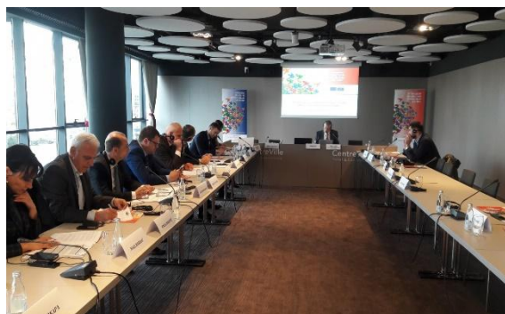
Radionica „Etika i sprječavanje sukoba interesa“, 8. mart 2017. godine