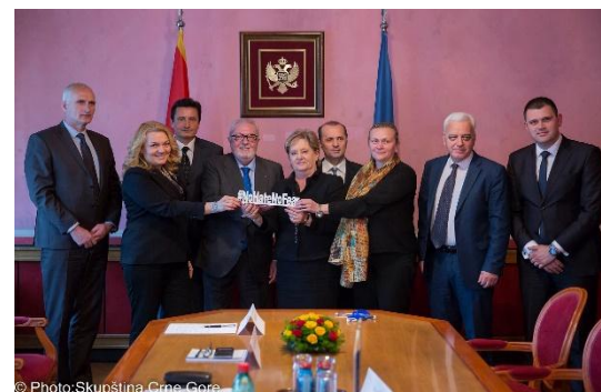
Sastanak predsjednika i članova Odbora za ljudska prava i slobode sa predsjednikom Parlamentarne skupštine Savjeta Evrope 16. mart 2017. godine