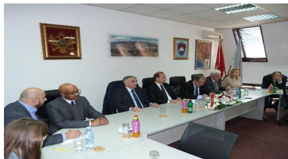
Posjeta predsjednika i članova Odbora za ljudska prava i slobode Maloj grupnoj kući u Bijelom Polju 7. novembar 2017. godine