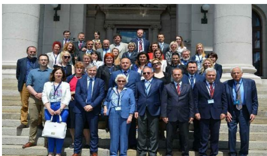
Međunarodna radionica „Saradnja evropskih parlamentaraca u borbi protiv trgovine ljudima u zemljama Zapadnog Balkana“ Beograd, 17. i 18. maj 2017. godine