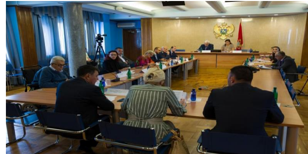
Konsultativno saslušanje na temu: “Rad dnevnih centara za djecu sa smetnjama u razvoju i osobe sa invaliditetom u Crnoj Gori”, 25. septembar 2019.