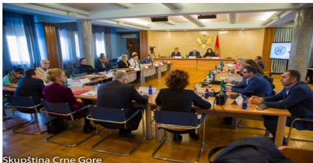
Kontrolno saslušanje ministra za ljudska i manjinska prava Mehmeda Zenke i ministarke javne uprave Suzane Pribilović 11. decembra 2019. godine