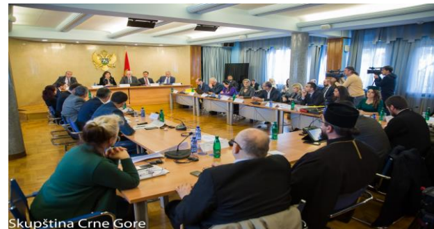
50. sjednica Odbora za ljudska prava i slobode 23. decembar 2019.