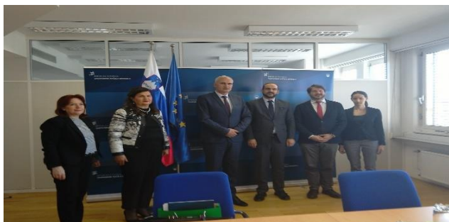
Studijska posjeta Odbora za ljudska prava i slobode Republici Sloveniji 25. mart 2019