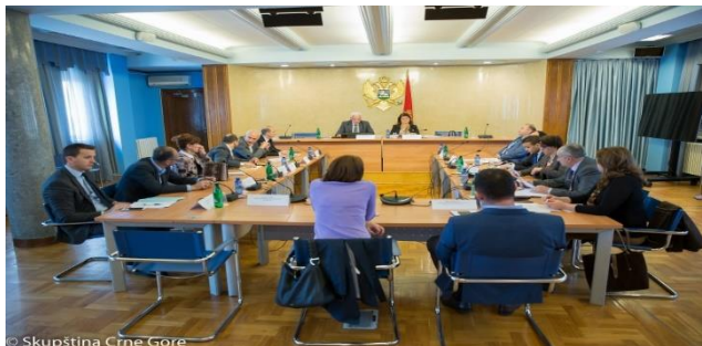
36. sjednica Odbora za ljudska prava i slobode, 15. april 2019.