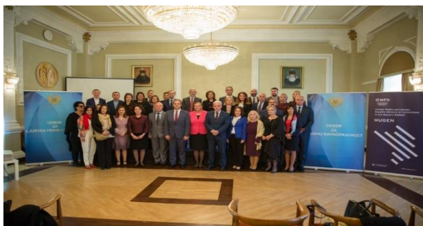
Regionalna parlamentarna konferencija na temu „Osnaživanje regionalne saradnje i nadzora zakonodavstva u oblasti ljudskih prava i rodne ravnopravnosti na Zapadnom Balkanu“ Cetinje, 8. oktobar 2019. godine