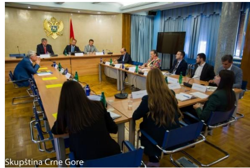
Skupština Crne Gore

Članovi Odbora za međunarodne odnose i iseljenike razmotrili su i većinom glasova podržali predlog da Zoran Janković bude izvanredni i opunomoćeni ambasador Crne Gore – stalni predstavnik – šef Stalne misije Crne Gore pri Savjetu Evrope, na rezidentnoj osnovi, sa sjedištem u Strazburu, na 59. sjednici , 9. septembra.