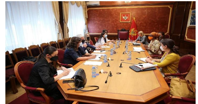
Sastanak sa specijalnom izvijestiteljkom UN-a, 10.09.2021