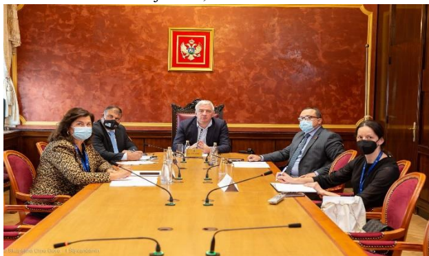
Multilateralni sastanak HUGEN-a, 29.09.2021.