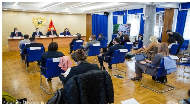
Treća sjednica, 21.01.2021.