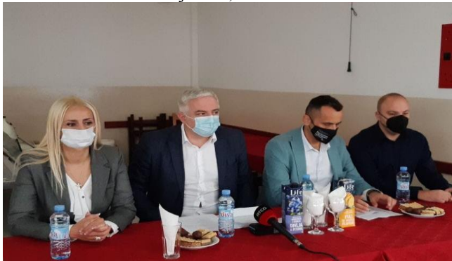
Posjeta Centru za prihvat u Spuzu, 10.11.2021.