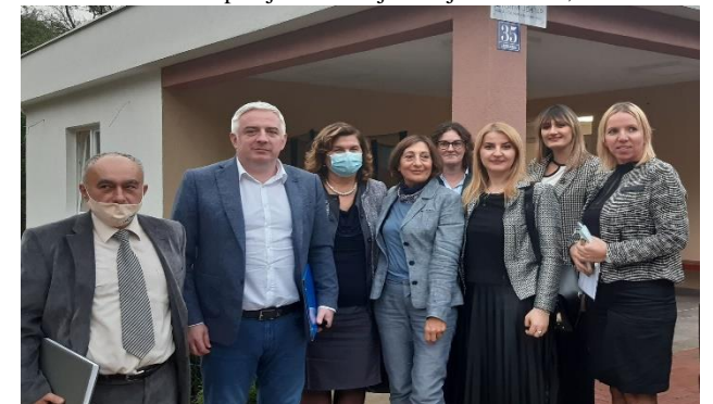
Posjeta Dječjem domu „Mladost“ i Dnevnom centru za djecu sa smetnjama i teškoćama u razvoju u Herceg Novom, 17.11.2021.