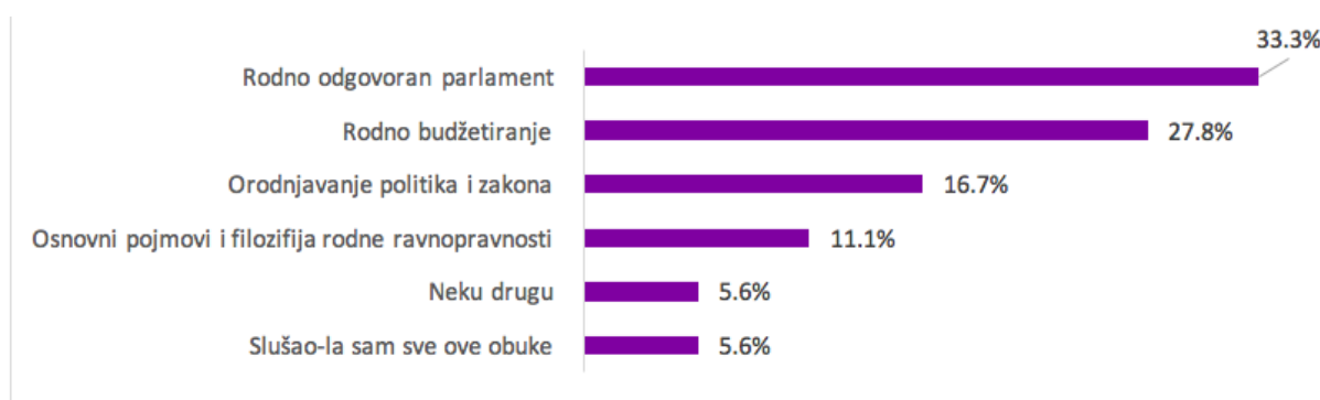
Slika 4: Interesovanje za pojedine teme

U grafiku koji slijedi predstavljeni su odgovori na pitanje koje obuke bi zanimale ispitanike i ispitanice. Jedna trećina njih je istakla rodno odgovoran parlament kao temu, dok je nešto više od četvrtine zainteresovano za temu rodno odgovornog budžetiranja.