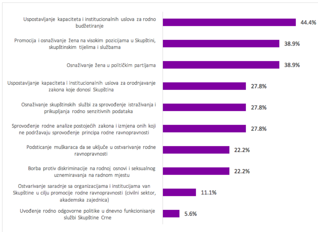
Slika 1: Proritetne oblasti za postizanje rodno odgovorne Skupštine