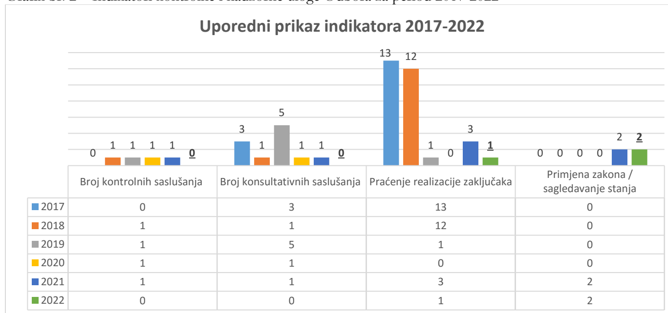
Grafik br. 2 – Indikatori kontrolne i nadzorne uloge Odbora za period 2017-2022

U cilju praćenja realizacije skupštinskog zaključka (33/21-7/7) 7 , usvojenog povodom razmatranja Predloga zakona o završnom računu budžeta Crne Gore za 2020. godinu, a kojim se podržavaju nalazi, mjere i preporuke DRI, Ministarstvo finansija (MF) dostavilo je Odboru Informaciju o realizaciji Akcionog plana za implementaciju preporuka DRI na kraju I kvartala 2022. godine (broj 00-63-7/22-49 od 1. septembra 2022. godine).