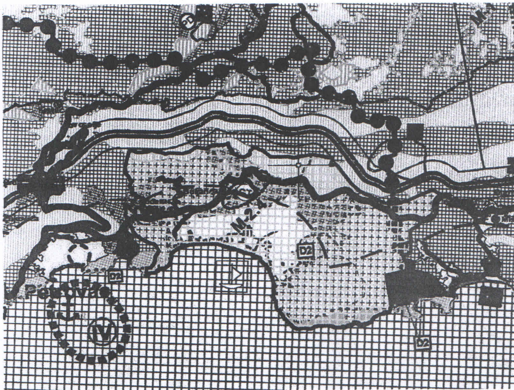
Izvod iz Nacrta Prostornog plana posebne namjene za obalno područje

računa o zaštiti vlasničkih prava građana koja imaju imovinu u Buljarici, a u cilju zaštite prostorne cjeline. Navedenim planskim rješenjem primjenjen je princip integralnog sagledavanja cjelokupne lokacije, koji je namjenu definisao u skladu sa principima zaštite životne sredine i optimalne valorizacije cjelokupnog prostora Buljarice, bez obzira da li se radi o privatnom ili državnom vlasništvu. Na cjelokupnom prostoru primjenjeni su jednaki indeksi izgrađenosti i zauzetosti, ista namjena, ali i jednaki principi zaštite životne sredine po pitanju poštovanja obalnog odmaka, uvažavanja zelenih prodora (cezura), poštovanja smjernica zaštite kulturne i prirodne baštine. Na taj način, svi imaoци prava na predmetnom zemljištu dovedeni su u ravnopravan položaj po pitanju mogućnosti za buduću valorizaciju ovog lokaliteta.