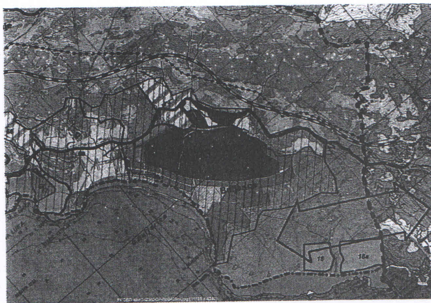
Izvod iz GUP priobalnog pojasa Opštine Budva, sektor Kamenovo-Buljarica

Prostorni plan Opštine Budva („Službeni list Crne Gore“ broj 30/07), kao i Generalni plan priobalnog pojasa Opštine Budva, sektor Kamenovo-Buljarica („Službeni list RCG – opštinski propisi“ broj 35/05) ovaj prostor prepoznaju kao najdragocjeniji razvojni resurs koji treba maksimalno turistički valorizovati, i kao takav ga detaljnije i razrađuju, predviđajući izgradnju turističkih kapaciteta i marine.