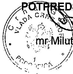
mr. Milutin Simović