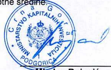
Mladen Bojanić MINISTAR