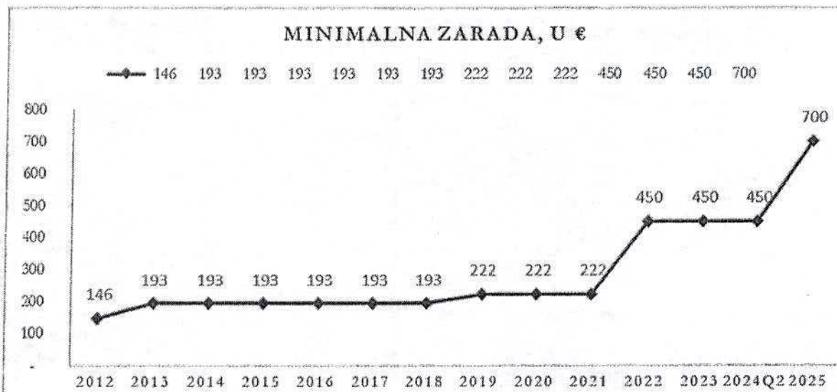
Grifik 1: Minimalna i prosječna zarada u Crnoj Gori (prethodni period i nakon reforme)

*U 2025. godini u obzir uzeta prosječna minimalna zarada (prosjeak MZ od 600€ i 800€)