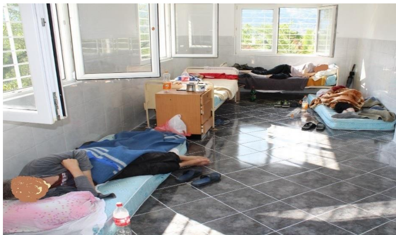
Pacijenti spavaju na dušecima na podu

Zapaženo je da pacijenti ne mogu slobodno da priđu svom krevetu, već moraju preskakati pacijente koji nemaju krevet, nego su smješteni na podu prostorije u kojoj borave. Ovakvi smještajni uslovi vrijeđaju ljudsko dostojanstvo i narušavaju osnovna ljudska prava pacijenata. 24 U sobama nema ormarića uz krevete a tamo gdje ih ima, stari su i dotrajali i većina njih nemaju brave. 25