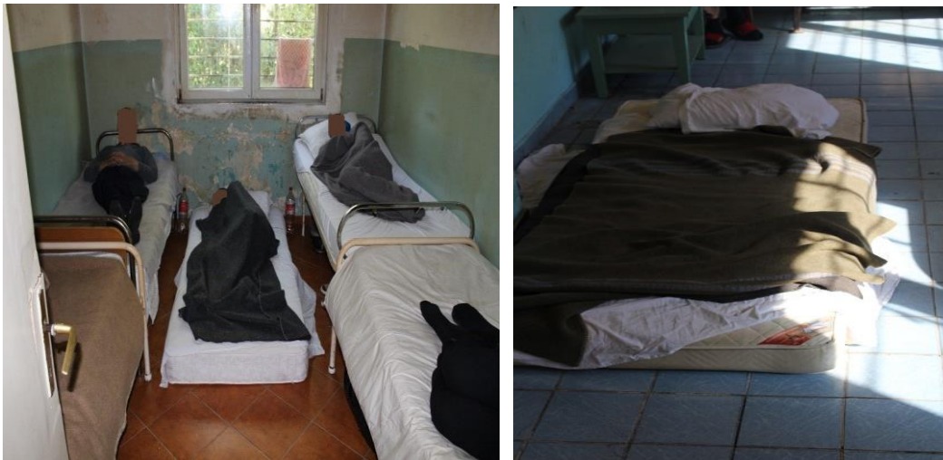
Pacijenti spavaju na dušecima na podu

Prilikom obilaska zatečeno je zabrinjavajuće stanje u pogledu broja pacijenata i načina na koji se oni smještaju. Veliki broj pacijenata je spavao na dušecima, koji su se nalazili na podu.