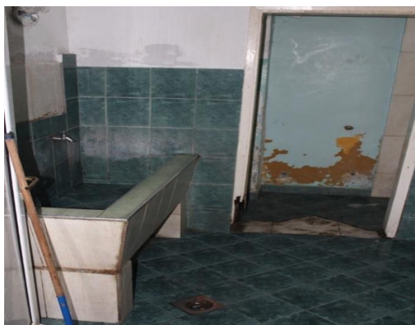
Toalet na hroničnom odjeljenju