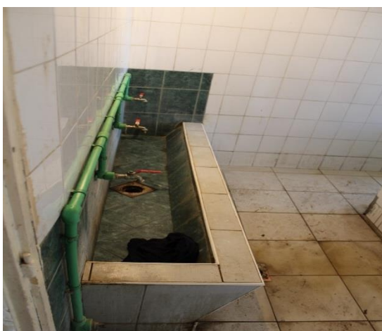
Umivaonik na hroničnom odjeljenju

U toaletima i kupatilima zidovi su i dalje oronuli i prekriveni vlagom. Ponegdje ima polomljenih podnih pločica. Sanitarna oprema (, lavaboi, česme, tuševi i WC vodokotlići) je stara, zardala, dotrajala i vidno oštećena. Od ranijeg obilaska NPM-tima vidno je da se i u tom pogledu pogoršalo stanje. Neprijatni mirisi, vlaga i buđ zastupljeni su u većini odjeljenja i soba. Uprkos lošim uslovima higijena se održava u skladu sa mogućnostima. Naime, manjak osoblja je izražen imajući u vidu da svega jedna higijeničarka i jedan domar održavaju ovoliko odjeljenja.