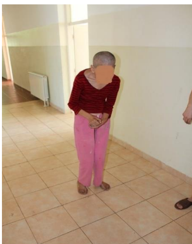
Pacijentkinja na ženskom hroničnom odjeljenju