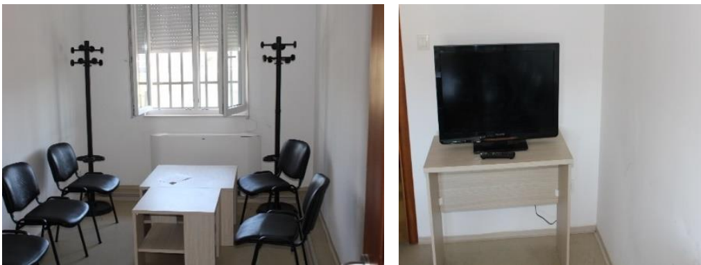
Dnevni boravak u Prihvatilištu

Tim NPM-a je zapazio da, pored uloženog napora Ustanove na realizaciji ove preporuke glavni problem predstavljaju nedostatak materijalnih sredstava i dugotrajne tenderske procedure.