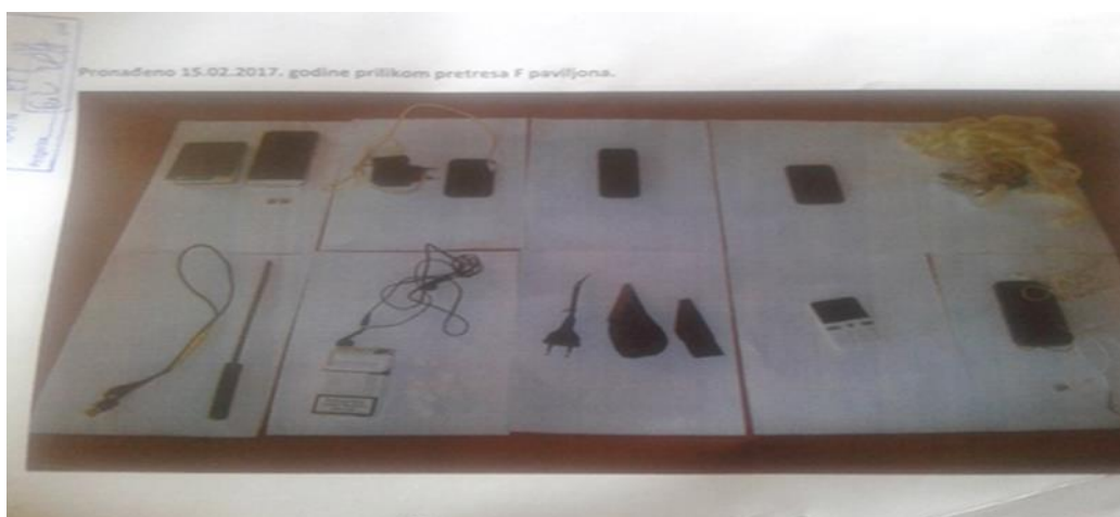
Pronađeni nedozvoljeni predmeti

Niko od zatvorenika koji su bili podvrgnuti pretresu i kod kojih su pronađeni nedozvoljeni predmeti, nije imao primjedbe na postupanje službenih lica.